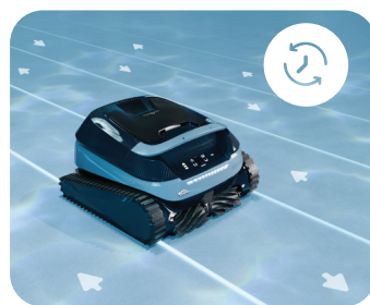
SmartMap Navigation + UltraRun Modus

Fängt ultrafeine Partikel auf und reduziert die Filterreinigung.